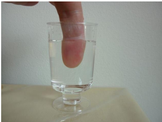
Figuur 5 Vinger aan de voorkant.