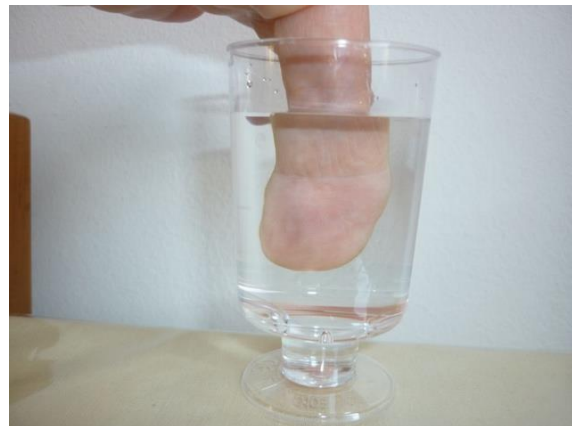
Figuur 6 Vinger aan de achterkant, het glas water functioneert als vergrootglas.