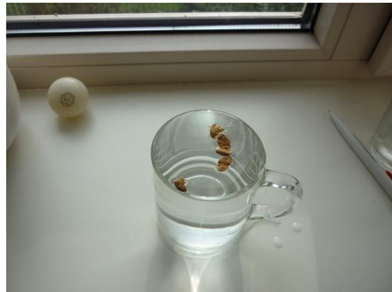
Figuur 2 Kurk op bol wateroppervlak.