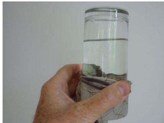
Figuur 4 Een glas water en een zakdoek als deksel, omkeren.