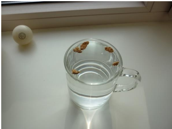
Figuur 1 Kurk op hol wateroppervlak.

geheel langzaam naar de rand van de tafel en geef dan een ruk (figuur 3). Het glas blijft staan, het verzet zich tegen versnelling... dat is traagheid.