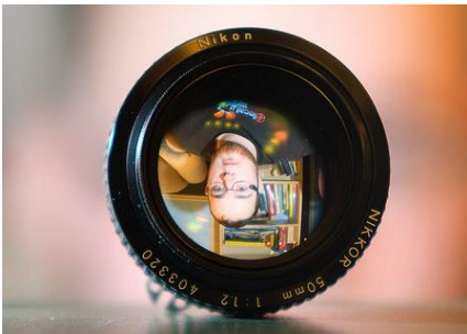
Figuur 5 Een bolle lens maakt een omgekeerd beeld