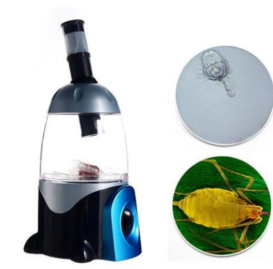
Figuur 2 Microscop

Een optisch apparaat is vaak bedoeld om iets beter te kunnen bekijken. Met een microscoop kijk je naar kleine voorwerpen, met een verrekijker of telescoop kijk je naar grote voorwerpen die ver weg staan.