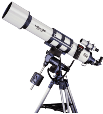
Figuur 15 Een lenzentelescoop

De vergroting van een telescoop geeft aan hoeveel keer groter je het voorwerp ziet vergeleken met het blote oog. Deze vergroting wordt ook wel de hoekvergroting genoemd.