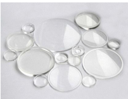
Figuur 3 Kunststof lenzen

De lenzen die je gaat gebruiken zijn gemaakt van acryl, een kunststof die je goed kunt lijmen. Het nadeel van acryl is wel dat er snel krassen in komen. Je krijgt een aantal lenzen die geschikt zijn voor het optisch apparaat van je keuze. Daaruit kies je twee lenzen.