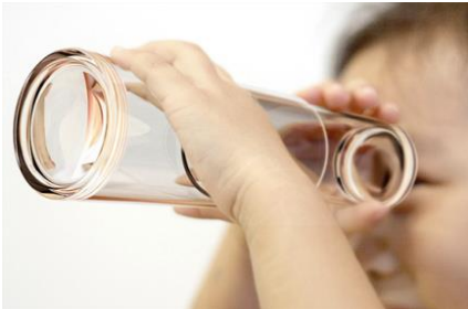
Figuur 1 Telescoop of verrekijker