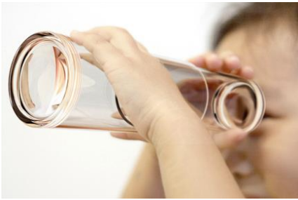
Figuur 4 Telescoop of verrekijker

Een eenvoudige telescoop bestaat uit twee lenzen. Met de voorste lens, het objectief , wordt een afbeelding gemaakt van het voorwerp. Door de tweede lens, het oculair , kijk je van dichtbij naar het beeld dat de eerste lens gemaakt heeft.