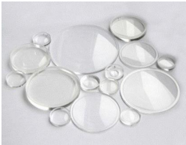
Figuur 4 Kunststof lenzen

a Onderzoek welke lenzen het meest geschikt zijn. Probeer verschillende combinaties en controleer of de vergroting (ongeveer) klopt met wat je berekend hebt. Noteer welke lenzen je gaat gebruiken, en bereken de vergroting.