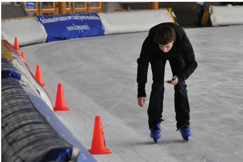
Figuur 4 Meting van de tijdsintervallen met geheugenstopwatch (experiment 3).

vaardigheid en schaatstype op deze metingen een verwaarloosbaar effect hebben. Omdat het nationale jeugdteam ijshockey in Eindhoven traint en een aantal van deze kinderen op het Sint-Joriscollege zitten kan het verschil tussen de schaatsvaardigheid en schaatsen van leerlingen in een groepje groot zijn. Zelfs bij deze technisch betere schaatsers blijkt de glijwrijvingscoëfficiënt niet af te wijken. Als meerdere groepen met elkaar vergeleken worden, blijkt wel de ijskwaliteit (voor of na een baanverzorging) invloed te hebben op de meetresultaten. Binnen één groep valt dat niet op omdat ze als groep binnen korte tijd allemaal deze metingen hebben uitgevoerd.