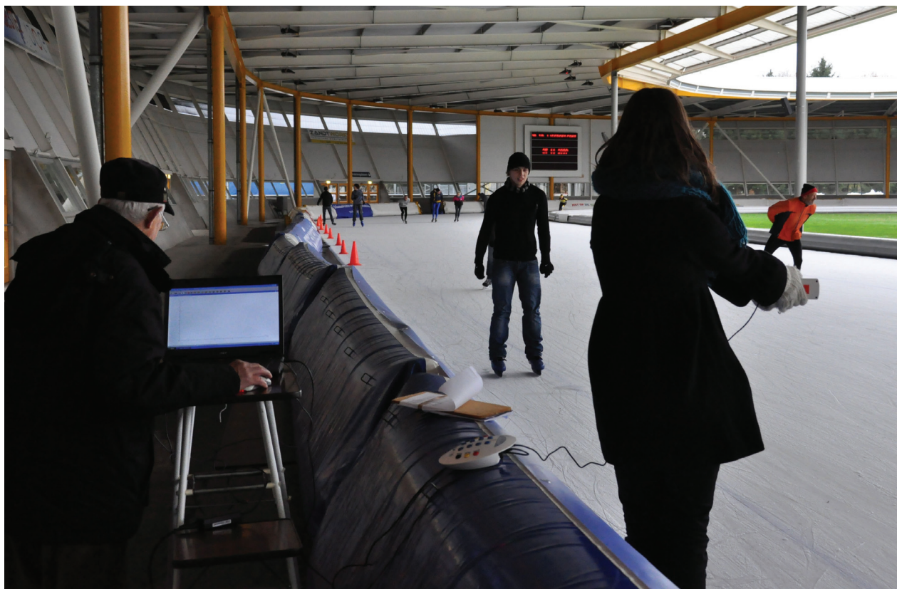
Figuur 5 Creëren van een x,t -diagram (experiment 4).

sensor zijn in het laboratorium met een luchtkussenbaan en een vlakke metalen plaat mooie x,t -diagrammen te maken. Ook na tweemaal differentiëren zien de grafieken er vaak nog zeer netjes uit, ook zonder bewerking van de metingen.