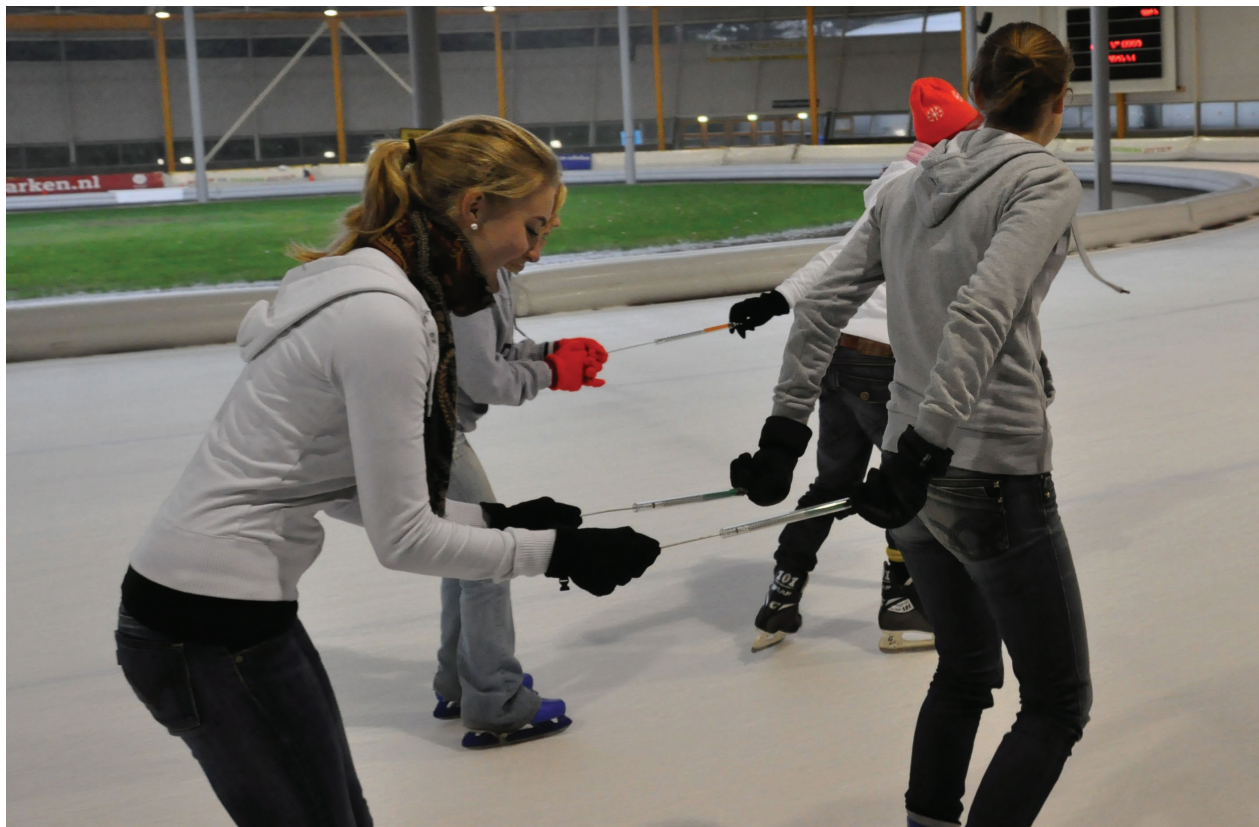
Figuur 2 Bepaling glijwrijving (experiment 2).