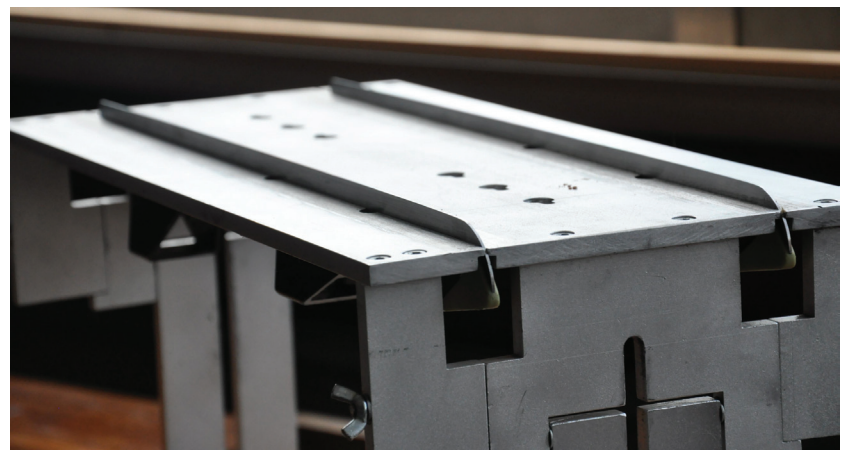
Figuur 7 Schaatsen in slijpblok.

Om docenten verder te informeren over deze experimenten is er een werkgroep op de Woudschotenconferentie 2013. Zodra de experimenten beschikbaar zijn zal dit bekend gemaakt worden op www.tue.nl/schaatsproject .