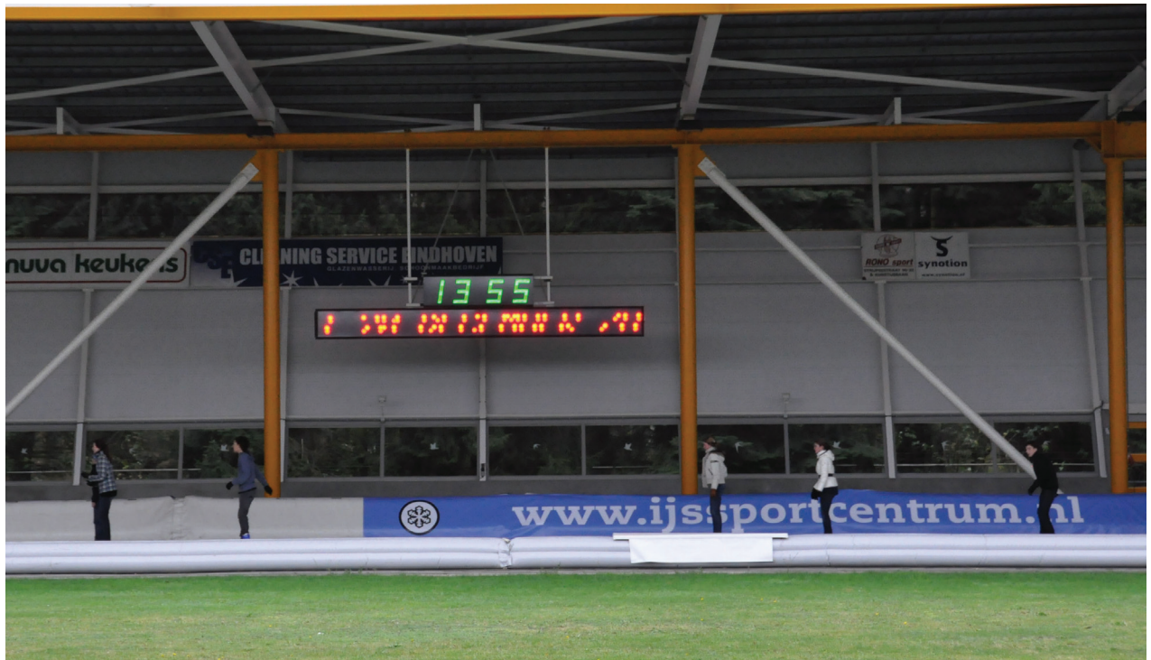
Figuur 6 Opname voor videometing (experiment 5).

het eerste experiment (Arbeid en kinetische energie) wordt dan een iets moeilijker in verband met de uitglijafstand.