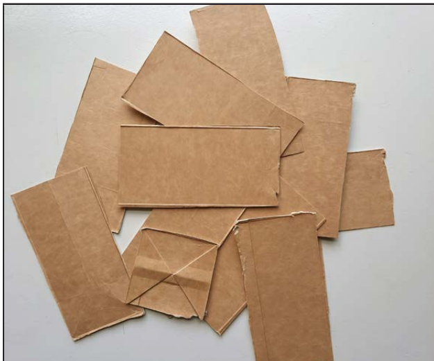
Leg alle stukken op een stapel. Draai de bruine kanten naar boven.