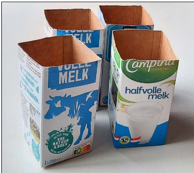
4 drinkpakken, 14 cm hoog