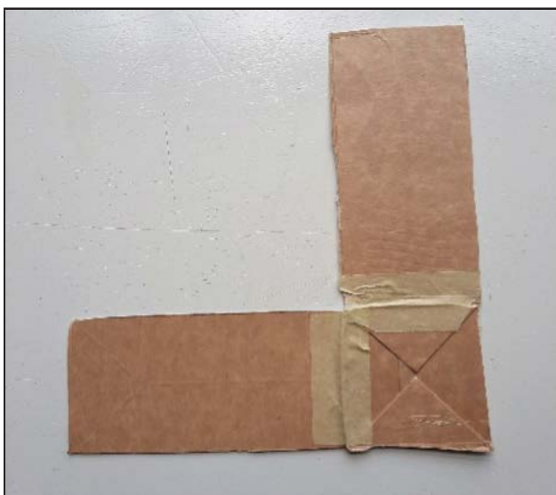
Plak de stukken aan elkaar. Gebruik tape.