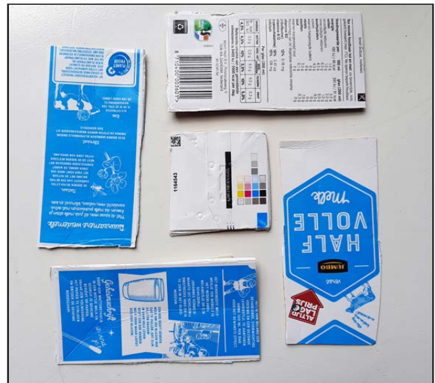
Knip van alle pakken alle zijden los.