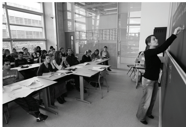
fig. 1

Euclides zou er zijn vingers bij hebben afgelikt en minister Plasterk gaat dat nog doen.