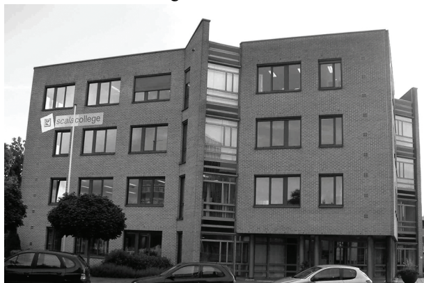
Het Scalacollege, locatie Sacharovlaan

De Wiskunde B-dag en de Alympiade zijn al jaren een vast onderdeel op de jaargenda van het Scala College. Dit jaar was er een primeur: de leerlingen van het tweetalig VWO kregen de opdrachten in het Engels voorgeschoteld, het verzoek Engels als voertaal te gebruiken en de werkstukken in het Engels te maken.