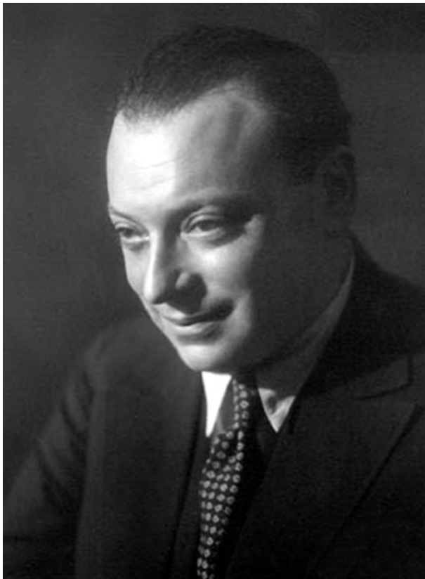
fig. 2 Wolfgang Pauli (1900 - 1958)

gevaarlijk zijn. Dat is hij echter juist dan het meest wanneer je probeert hem te negeren [...] Zodoende ben ik enerzijds angstig, anderzijds fascineert hij mij. Ik kan hem niet meer loslaten, zoals hij mij niet.'