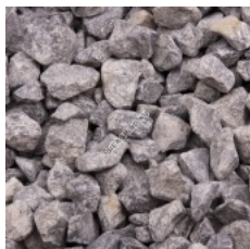
fractie 08 - 16