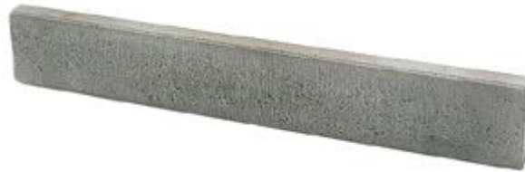
opsluitband 5 x 15 x 100cm grijs € 1,75 per stuk