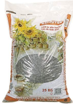
Gewicht 25 kg. Prijs per zak € 3,00