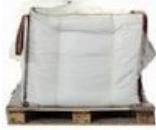
Gewicht ca. 600 kg. Prijs per Mini Big-Bag € 61