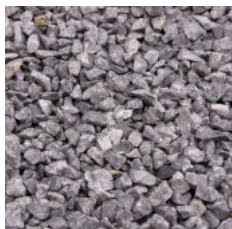
fractie 04 - 08