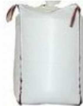
Gewicht ca. 1500 kg. Prijs per Big-Bag € 148

Bereken voor alle drie de prijs per kilogram. Als je wilt kun je verhoudingstabellen gebruiken.