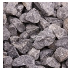
fractie 16 - 32