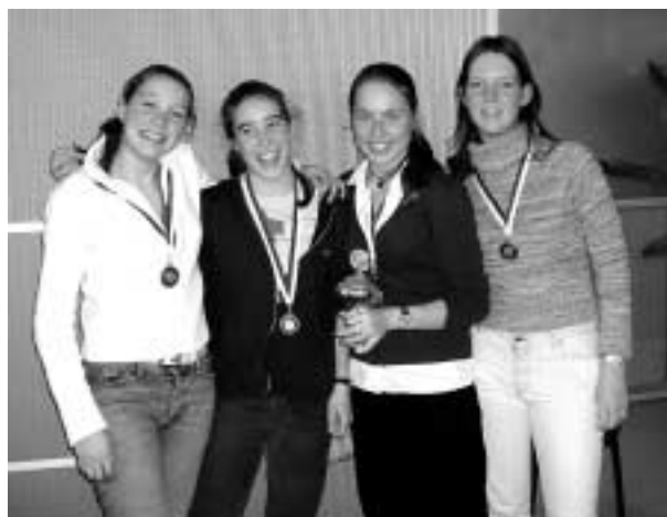
Team Lorentz Casimir Lyceum