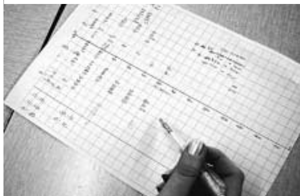
Een schema voor de depotplaatsing bij A2

Opgave A1 was bedoeld als een echt opwarmertje. Opgave A2 omvatte al veel meer en was bedoeld als voorwerk