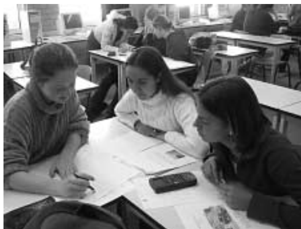
Een grafiek tekenen met behulp van de GRM

Bij de grafiek van B1 werden de waarden van A ingevuld en er werd gezocht naar een verband. Al snel was een aantal leerlingen met de grafische rekenmachine met verschillen van verschillen bezig. Dat was nog zo moeilijk dat de natuurkundeleraar werd ingeschakeld voor het gebruik van de rekenmachine.