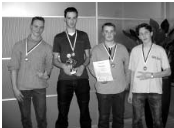
Team Gymnasium Juvenaat H. Hart

Het Lorentz Casimir Lyceum en de RSG De Borgen hadden een gedeelde tweede plaats.