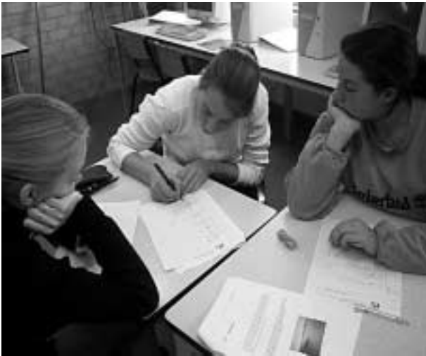
Het plan van aanpak uitschrijven

te rechtvaardigen en duidelijk uit te leggen waar men de depots plaatst afhankelijk van de afstand. Bovendien moest aangegeven worden hoeveel benzine in deze depots opgeslagen werd en wat dan de totale hoeveelheid benodigde benzine was.