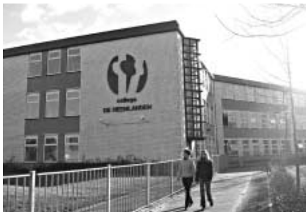
College De Heemlanden te Houten

Dit jaar is er besloten om op de dag zelf een school te bezoeken en de leerlingen gedurende de dag te observeren. Op 23 november 2001, 9.00 uur, het College De Heemlanden te Houten, was het dan zover. Er deden zeven teams (21 leerlingen) mee. Dit was de hele 5 vwo wiskunde B-afdeling. Op deze school wordt de Wiskunde B-dag, zoals op veel scholen, gebruikt als praktische opdracht.